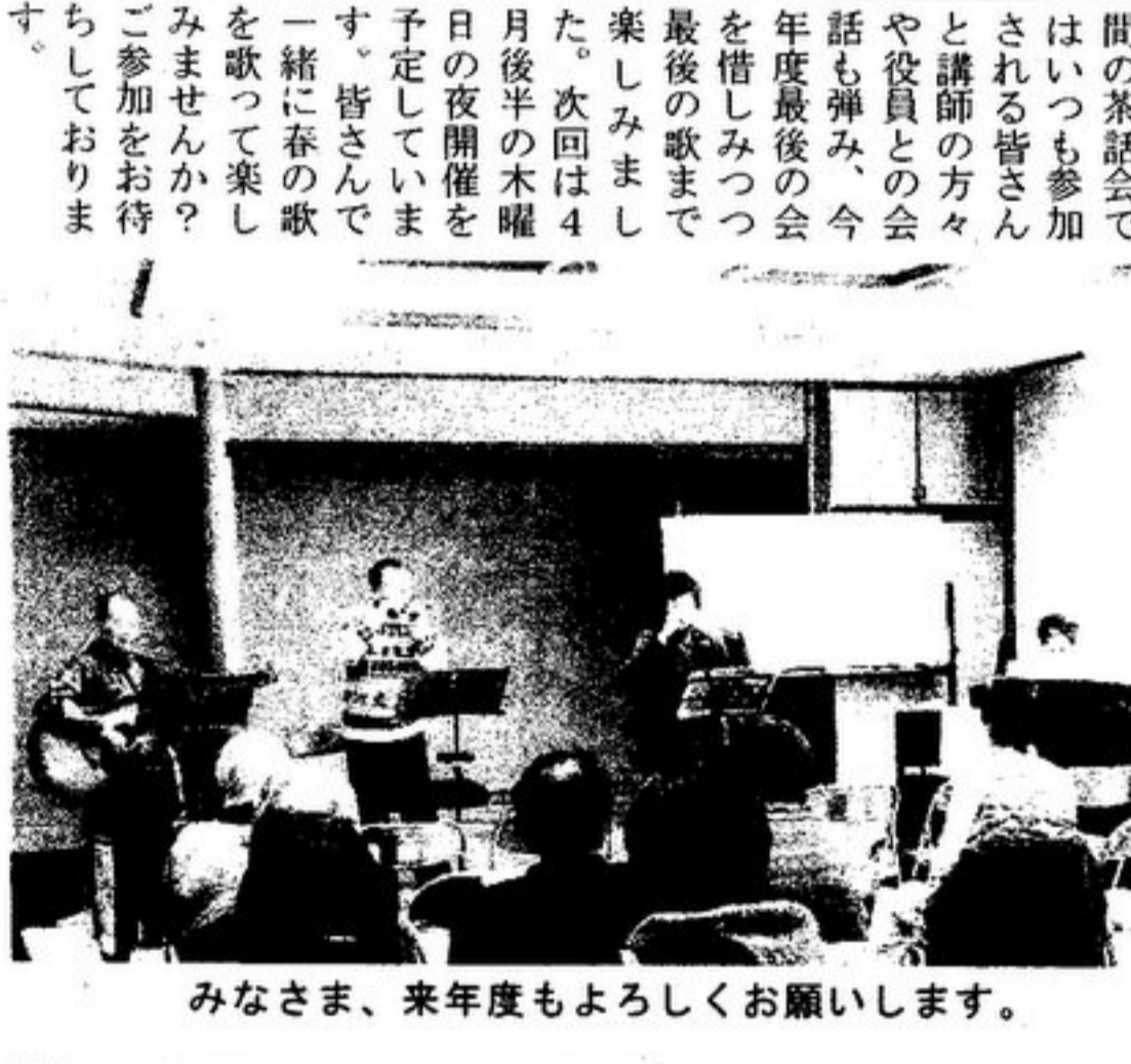
みなさま、来年度もよろしくお願ひします。

平成27年度最後の音楽の夕べが1月24日に開催されました。前日に降った雪が残り足元の悪い中でも大勢の方に参加していただきました。今回は雪やスキーなどの冬にちなんだ歌を多く選曲していただき、参加された皆さんと一緒に楽しく歌いました。暖冬から一転して、とても冷え込みが強く、皆さんの力強い歌声に寒さも吹き飛ばされたようなハッピーを奏でていました。合間の茶話会ではいつも参加される皆さんと講師の方々や役員との会話も弾み、今年度最後の会を惜しみつつ最後の歌まで楽しみました。次回は4月後半の木曜日の夜開催を予定しています。皆さんと一緒に春の歌を歌って楽しんでみませんか? ご参加をお待ちしております。