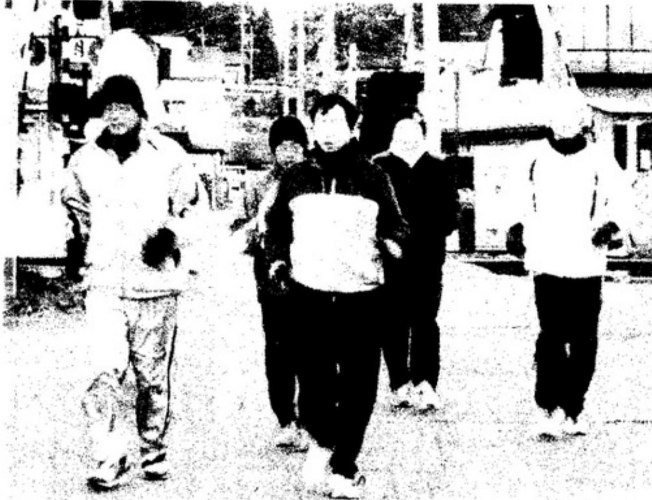
寒さに負けず、走る走る!