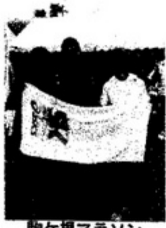
駒ヶ根マラソンに参加