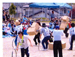
風の強い中、この競技もたいへんでした