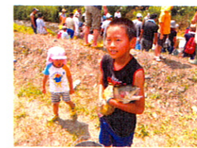
今年は、大物をしっかりGETして来ました(^_^)