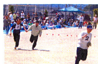
どうやら、区長代理が借り出されているようです!!