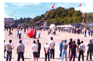
大玉送りは、白が優勢でスタート!!