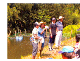
安全に、注意を守って楽しみましょう。