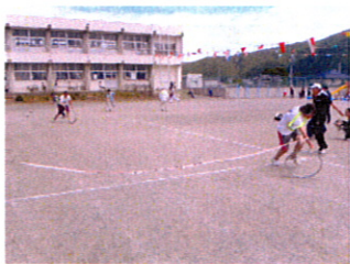
ゴールはもうすぐ! ガンバッテ!