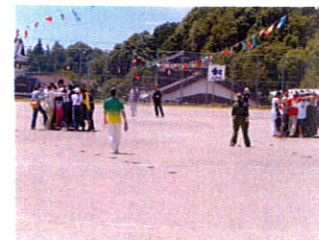
全員乗れたかなあ!? どちらが早く乗れたかな?