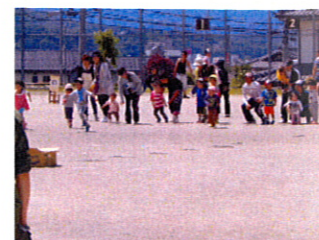
宝物めざしてがんばれ!