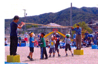
1番目の競技はパン食い競争先ずは、子供達からパワーを貰います!