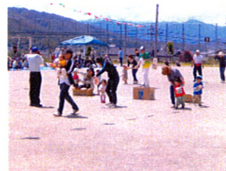
宝物拾ったら安心しちゃったかな!? 追い越されちゃうよ!