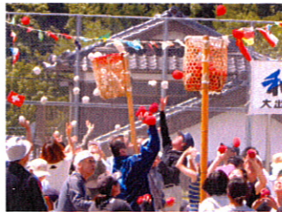
玉が大分たまって来ました！