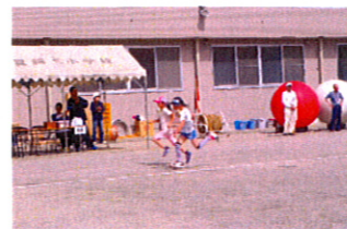
落とさないようにね!