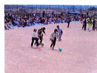
なかなか、思った方向にいきませんね!