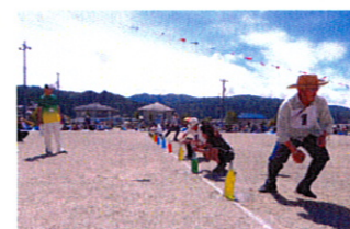
もう少しで取れそうですよ! がんばれ!がんばれ!