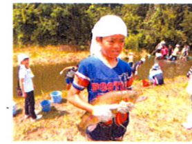
2匹も獲れましたね。どちらが大きいかな?