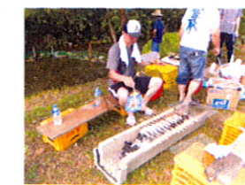
準備も始まりよいよこれからです!!