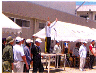
最後は万歳三唱で無事閉幕