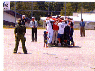
ウ〜ん、バランスとるのがむずかしいですね!