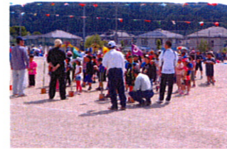
みんな、おつかれさま^^