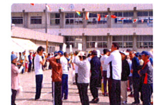
まずは、整列していただきラジオ体操で体をほくしました。