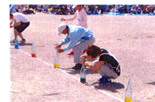
満水リレー。焦りは禁物! 水が溢れていますよ!