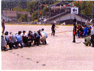
ますい、またまた白優勢です!