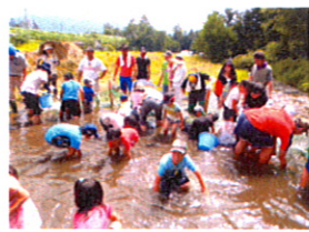
スポンが濡れても気にしている人はもういません^^