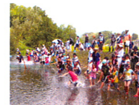
もの凄い、勢いで飛出しました。よーい、スタート!!

七月二十七日(日)深沢川にてマスカみ祭りが開催されました。小学生が約八十名ほど参加され、父兄共々歓声を上げて、夏のひと時を楽しみました。