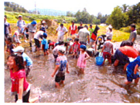
なかなか獲れないからほか探そうかな?