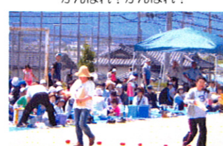
借り物競争のはじまりです。封筒のなかみは何でしょう??