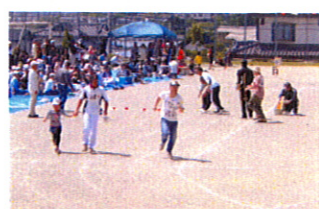
男の子も借り出されたのかな?!