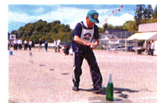
皆さん、暖かい目で見守っています! 最後までお疲れ様でした!