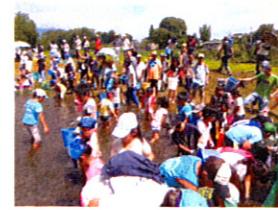
みんな、無我夢中ですね!(^_^)