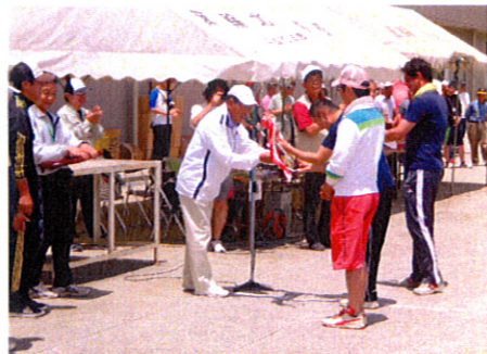
優勝した7常会の代表の方々です。おめでとうございます!

六月八日(日)、箕輪北小学校グラウンドにて大出区民運動会が開催されました。入梅前の不安定な天候により、前日の朝まで雨が降ったり止んだりとの心配でしたが、当日の朝は雲に覆われていたものの、競技には少し暑くなる頃には青空が広がり、当日の朝は雲に覆われていた学生が明るく元気に参加してくれて、大変パワーを頂いた。大勢の小競技は、小学生によるパン食い競争から始まり、満水リレー、何人入られるかな、混じった前回と同様の競技など、子供からお年寄りまで楽しめる競技が盛りだくさん。また、競技には絆を再確認するようなど、子供からお年寄りまで楽しめる競技が盛りだくさん。また、競技には絆を再確認するようなど、子供からお年寄りまで楽しめる競技が盛りだくさん。