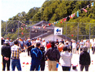
玉入れの玉が多くて数えるのがたいへんでしたね。