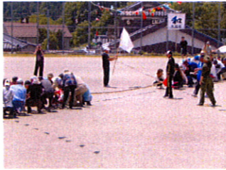
さあ、準備はいいですか?