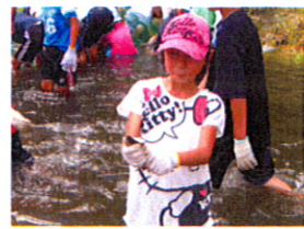
慣れたものです。落ち着いています!