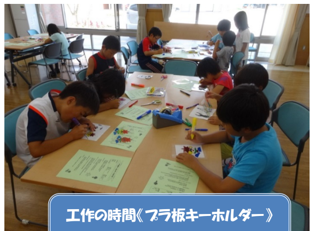
工作の時間《フラ板キーホルダー》 オリジナルキーホルダー作り