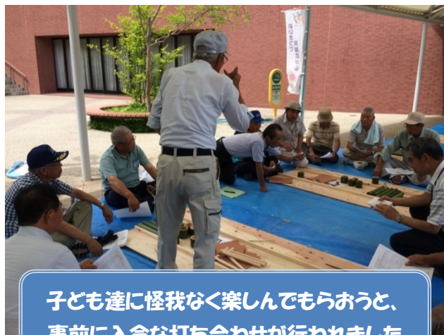
子ども達に怪我なく楽しんでもらおうと、 事前に入念な打ち合わせが行われました