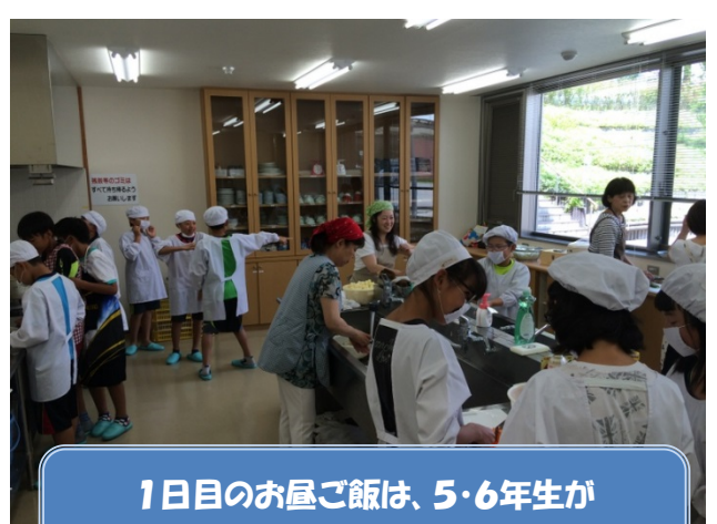
1日目のお屋ご飯は、5・6年生がおいしいカレーライスを作りました