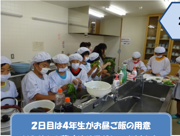
2日目は4年生がお昼ご飯の用意 そうめんの薬味やサラダをつきました