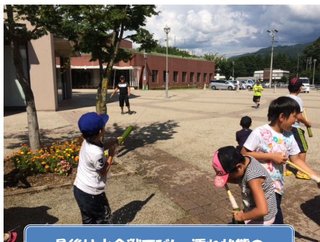
最後は水合戦でびしょ濡れ状態↑