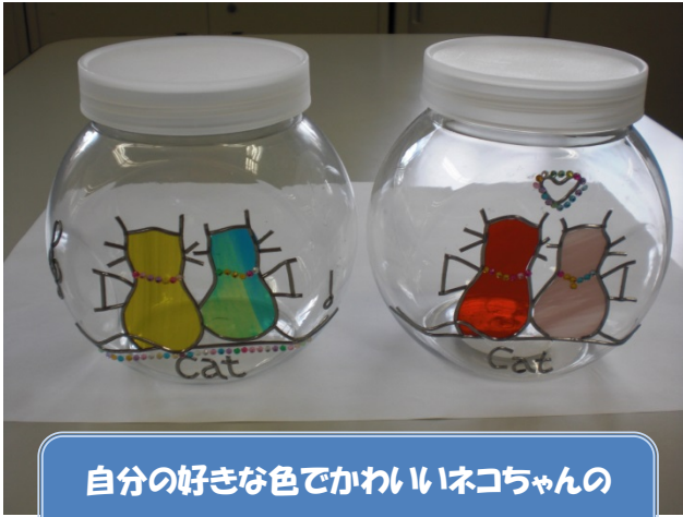
自分の好きな色でかわいいネコちゃんの キャンティポットの出来上がり♪