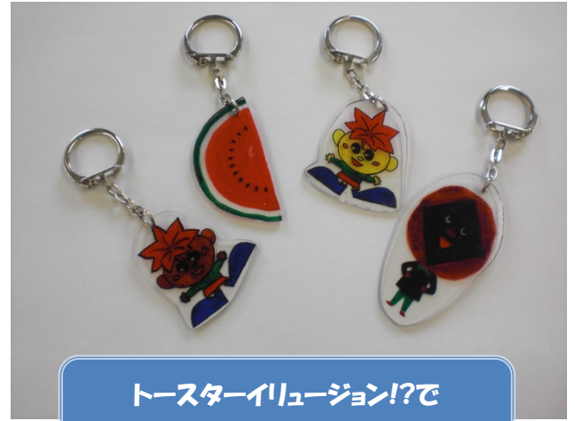
トースターイリュージョン!?で 世界に一つだけのキーホルダー😊