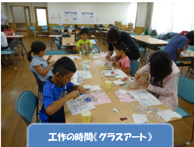
工作の時間《ガラスアート》 ネコちゃんのキャンティポット作り