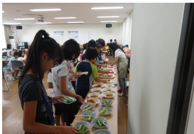
カレーライスと夏野菜をおいしくいただきました😊