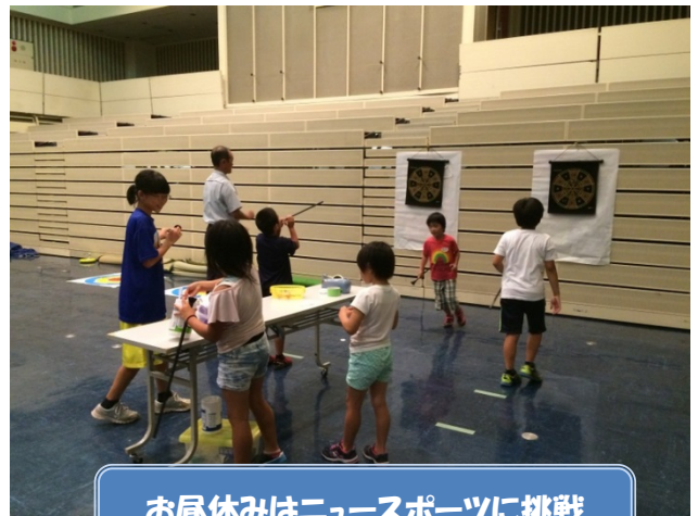
お昼休みはニュースポーツに挑戦