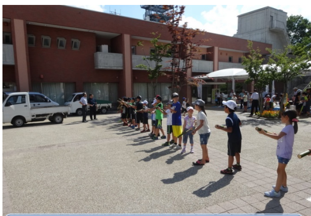
一番遠くまで水を飛ばせられたのは誰かな？