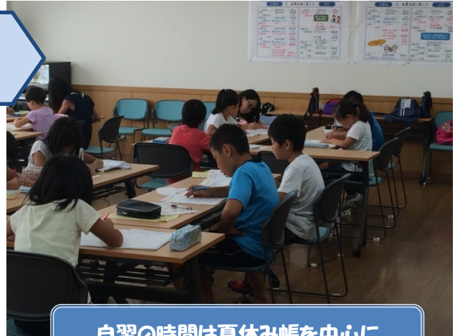
自習の時間は夏休み帳を中心に