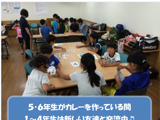
5・6年生がカレーを作っている間 1～4年生は新しい友達と交流中♪