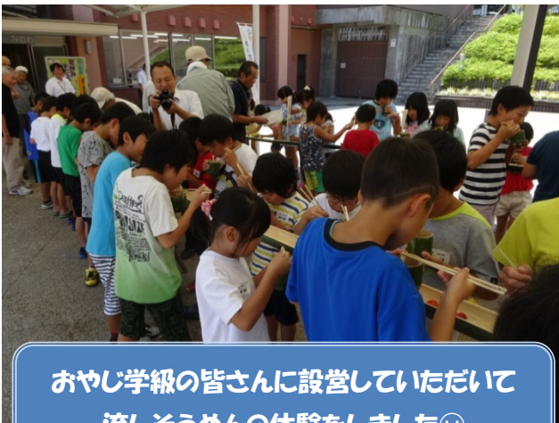
おやし学級の皆さんに設営していただいて 流しそうめんの体験をしました😊