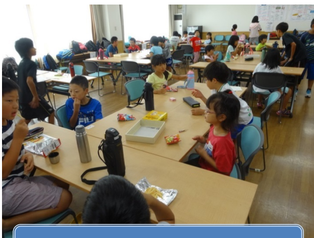
午前と午後におやつがありました😊