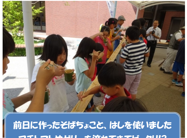
前日に作ったそばちょこと、はしを使いました フチトマトやゼリーも流れてきてビックリ!?