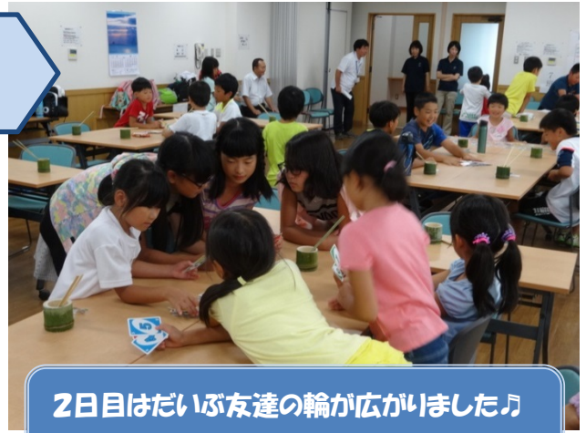
2日目はだいぶ友達の輪が広がりました♪ (4年生が調理をがんばっている間)