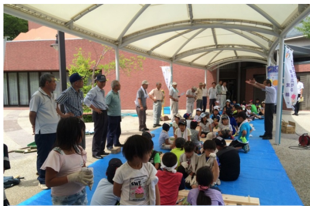
竹工作の講師は公民館おやし学級のみなさん