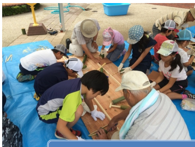
午後の工作の時間は竹で水鉄砲、そばちょこ、おはし作り。のこぎりに初挑戦!!