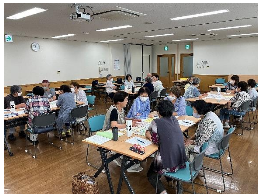
【「人生すごろく」で語り合う】

7月の各学級ごとの講座では、自分の人生を振り返りながら、お互いの思い出を語り合い、共感し合い、新たな今後の抱負も考えました。新しく知り合った仲間、今まで、よく知っているようで意外な一面も知った仲間…横の絆を深めながら、人との出会いを愉しむ一時を過ごすことができました。