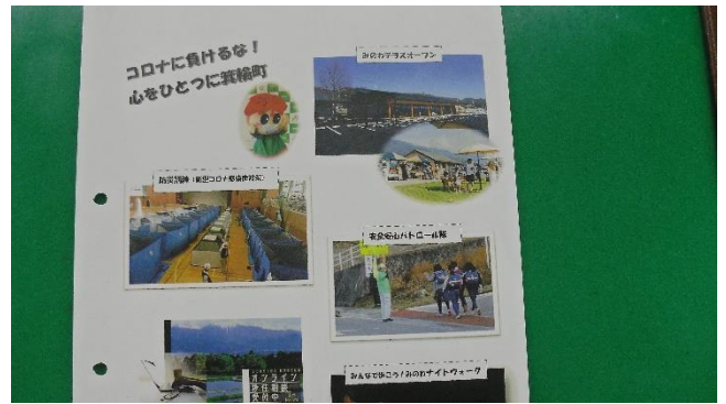
<コロナに負けるな！心をひとつに箕輪町>