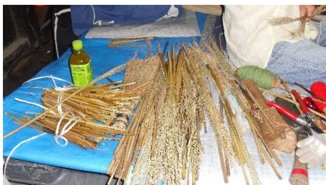
<様々な材料が用意されています>