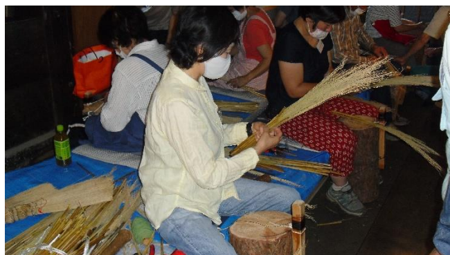
<ひと握りを麻糸でまき これを3つ合わせます>