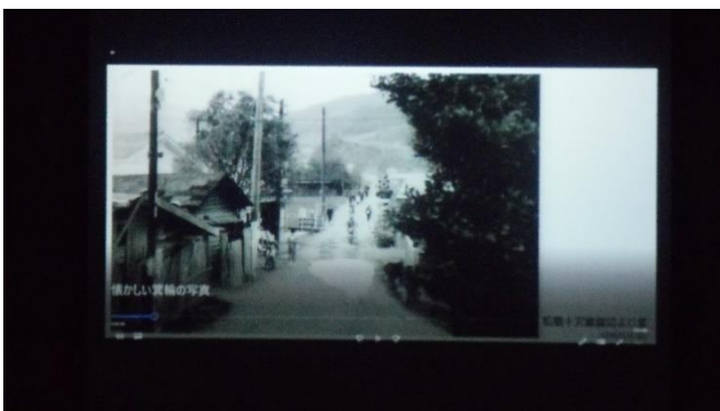
<十沢踏切から東をのぞむ>