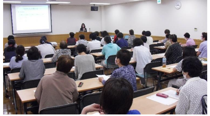
<身につまされることばかり よくおわかいで>