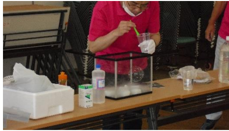
＜しゃぼん玉が空中で停止！？＞