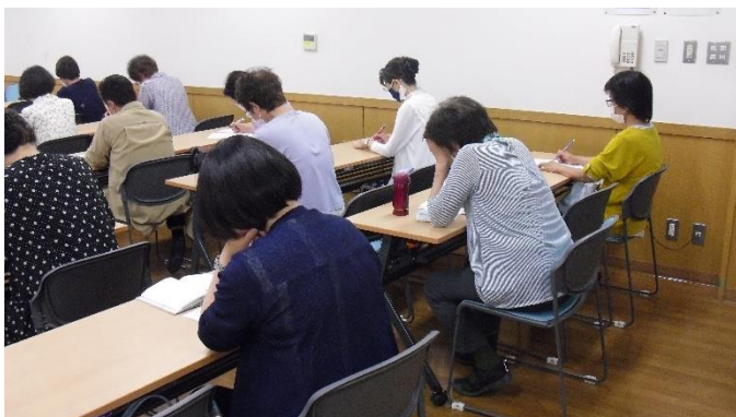
<問題文の空欄を埋めよ む、むずかしい>