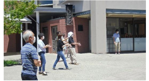
＜天までとどけっ えいっ！＞