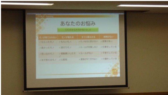
<あなたの悩みはみんなの悩み…>