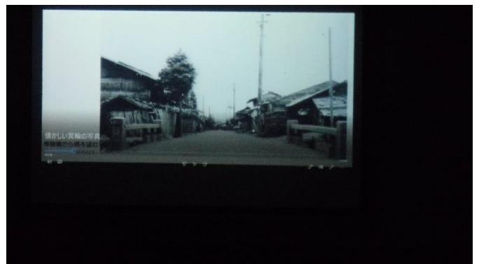
<帯無橋から南をのぞむ>