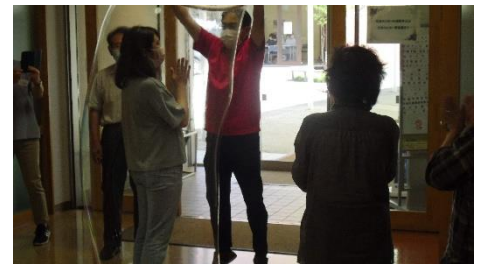
＜しゃぼん玉の中に人が入るっ！？＞