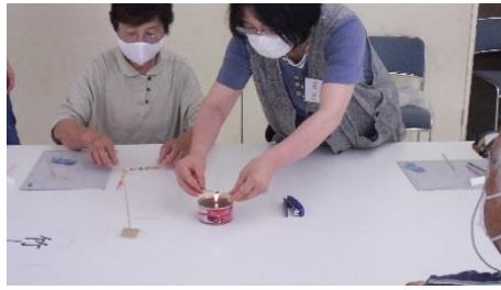
＜ろうそくの炎で竹をねじります＞