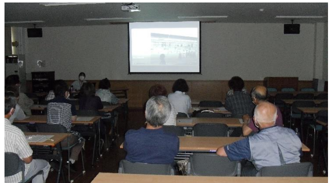
<ああ、そうそう、覚えてる覚えてる！>