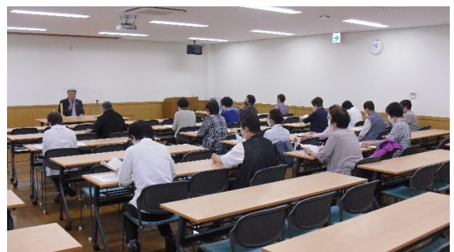
＜町長さんは話が上手です、さすが＞