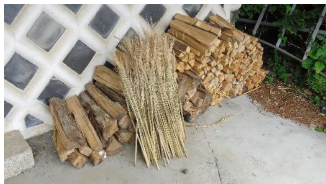
<材料はほうき草の茎です>