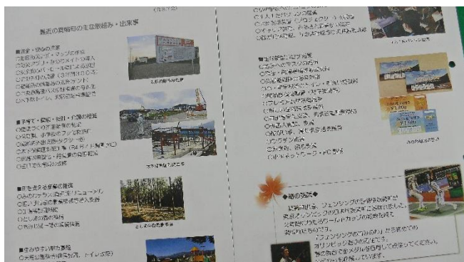
＜アイデアいっぱい 箕輪町の行政＞