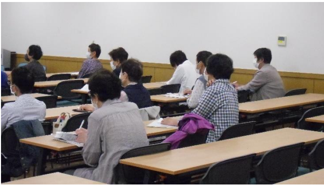
<思わず話引き込まれる…>