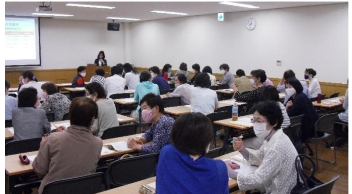
<お隣と意見交換を → 止まらないっ!>