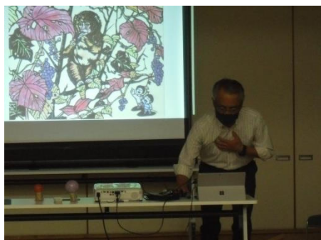
<講師は切り絵でも有名な先生>