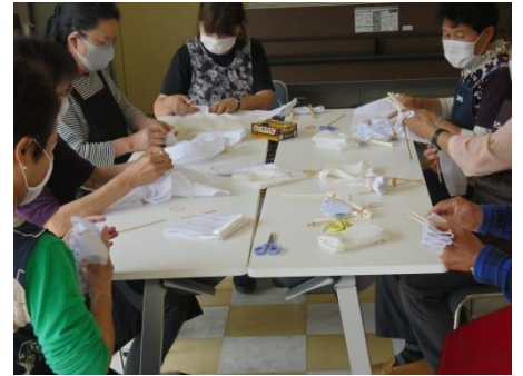
<割りばしや輪ゴムで挟みます>