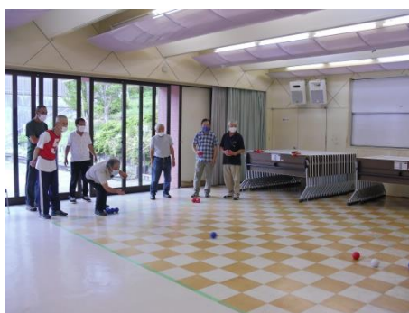
<こちらはポッチャ>