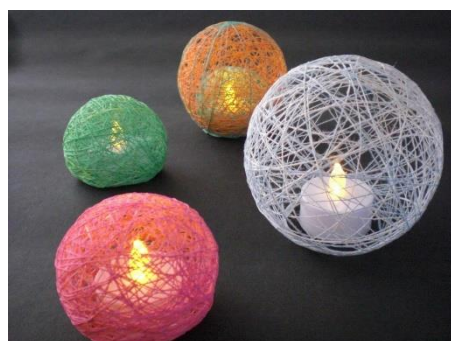
<翌日水風船をわると>