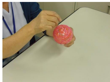
<接着剤を塗って上から色糸を巻き…>