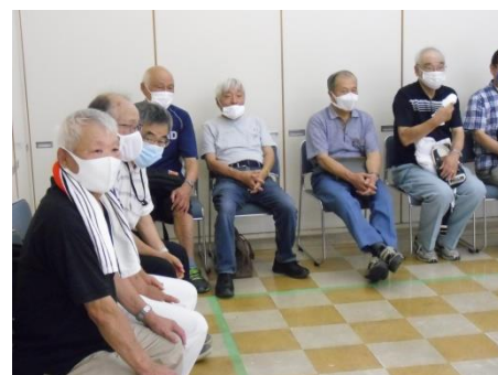
<満足満足、けっこうたびれる>