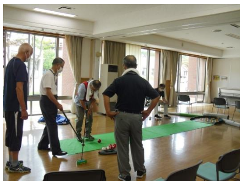
<向こうの穴に球を入れる>