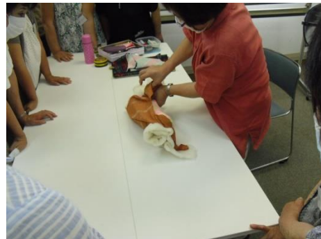
<ひっくりかえして>