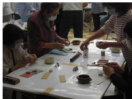
<ランプ/ケットを段ボールで巻く>