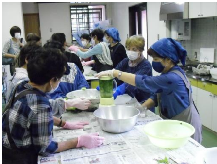
<葉をつみミキサーでかくはん>