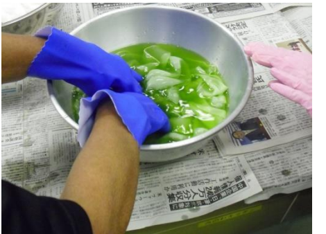
<きれいな黄緑色が…>