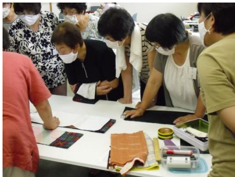
<先生の説明に集中する皆さん>