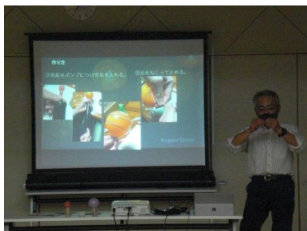
<わかりやすい説明!>