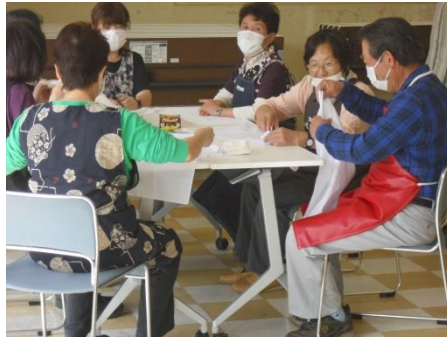
<バンダナやスカーフを作ります>