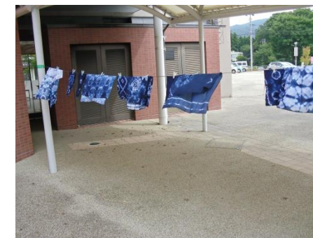
<濃い藍色もいい色です>