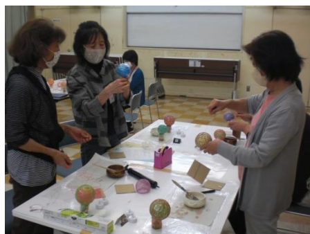
<段ボールの上このせる>