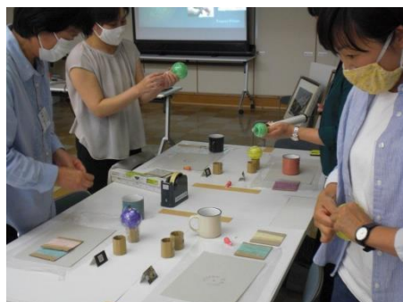
<水風船をふくらませ…>