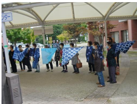
<でき上がった作品とともに>