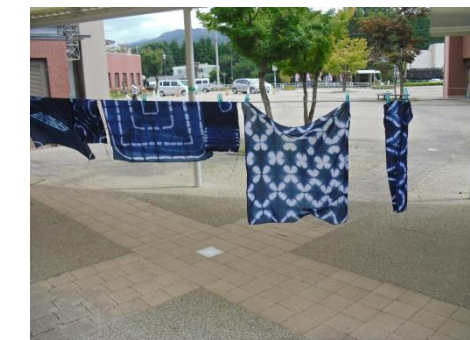
<手作り作品に愛着も一入>