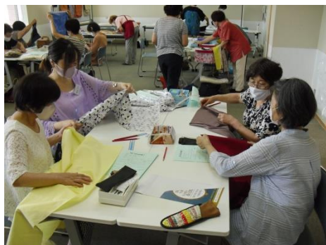
<家にあるお気に入りの布が材料>

「そんないいものを作っているのなら私にも作って、と友だちに言われ3つめを作りました。」