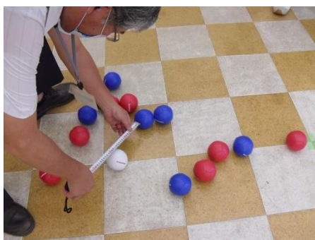
<わずかの差が勝負を分ける>