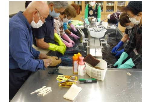
<水で洗い流します>