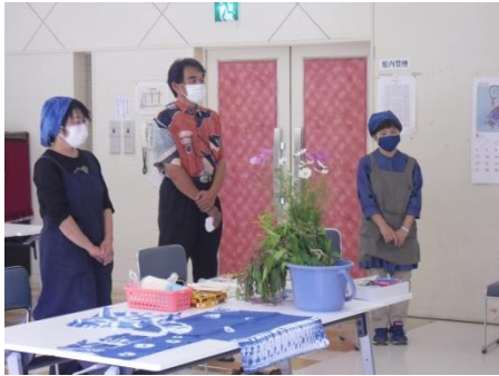
<講師の皆さんです>