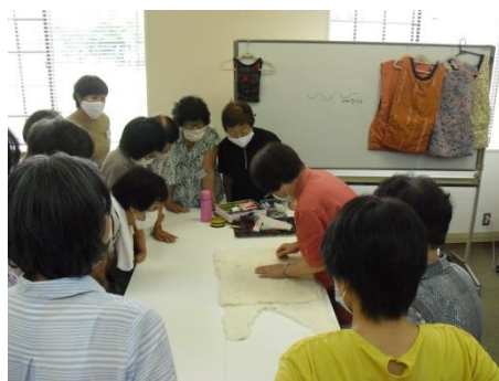
<綿をあてて糸でとめ>