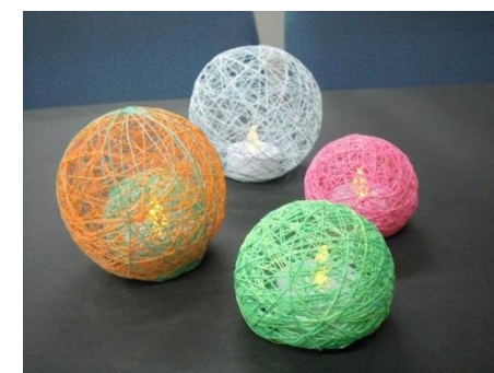
<幻想的なランプシェードが完成>