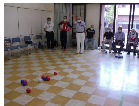
<白球に寄せたチームが勝ち>