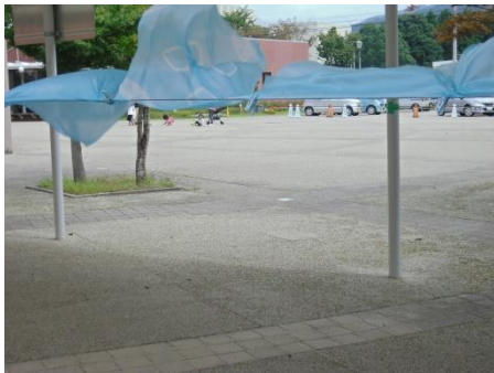
<空気にふれてうす青色に>