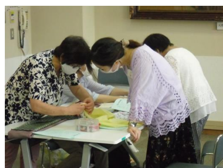
<そうやるんですかなるほど…>