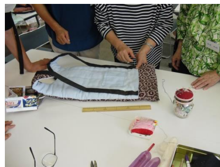
<先生のようにおいかみりけれど>