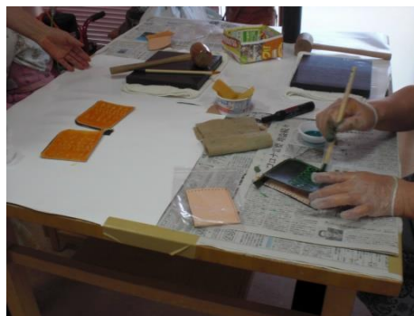
<仕上げにつや出しをぬきます>