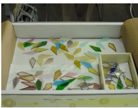
<カラフルなステンドグラス>