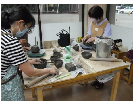
<様々な作品に挑戦します>

菊ねりは、土の中の空気を押し出し土を均一にします。空気が残ると、乾燥した時に割れる原因になります。