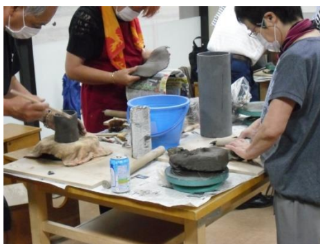
<筒に板状の粘土をはいつけます>