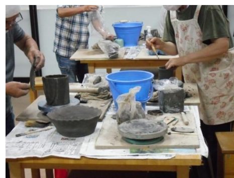
<ちょっと大物に挑戦>