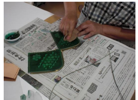
<かわいいウォレットの完成!>