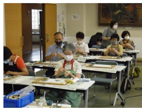
<ふちをテープで巻きます>