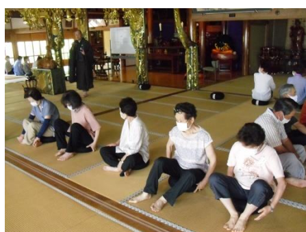
<足を組むのはむずかしい>