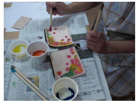
<色の変化も美しい>