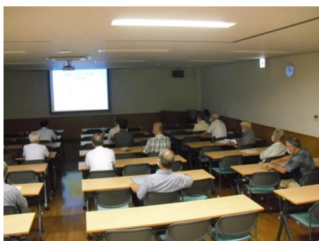
<中世は史料が残っていない>