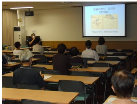
<今回は中世の信濃と箕輪町>