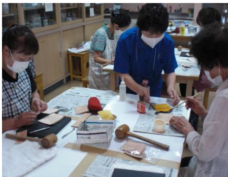
<模様の上から色づけ>