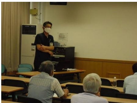
<講師は博物館の学芸員さん>