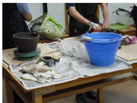
<手動ろくろと手びねり>