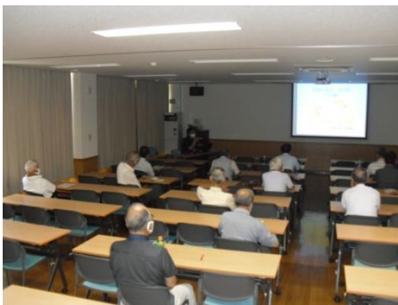
<織田と武田の対立に翻弄>