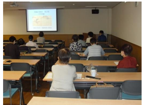
<知らなかったことばかり！>