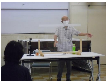
<暮らしに笑いと歌を>