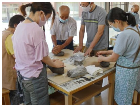
<菊ねりは基本中の基本>