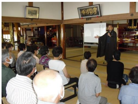
<法話をお聞きします>