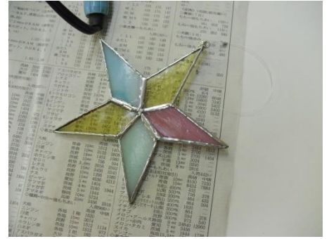
<美しい作品の完成！>