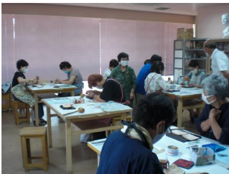
<材料はタンロウ(牛皮)>

あっという間に定員に達した人気のレザークラフト講座が8月19日に開かれました。材料の関係や受講生一人一人に丁寧に対応したいという講師の先生の意向もあり、定員10名の講座でした。