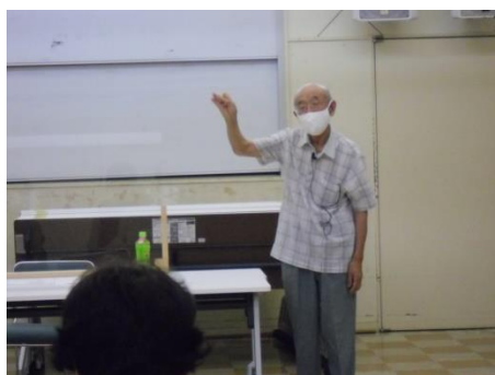
<笑いの療法士さん>