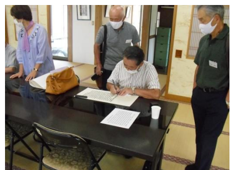
<般若心経を写す、緊張緊張>