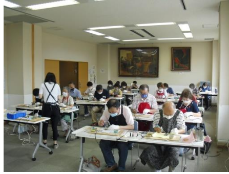
<みなさん真剣です>