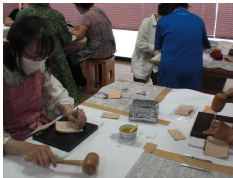
<木づちで刻印を打つ、楽しい>