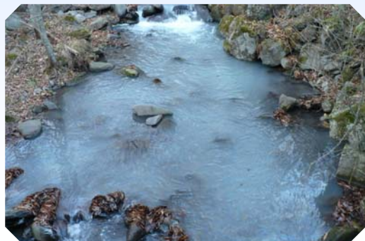
重油流出事故の様子

油や農薬などが河川へ流出してしまったり、水質の異常によって魚が死んでしまったりする「水質汚濁事故」が多発しています。